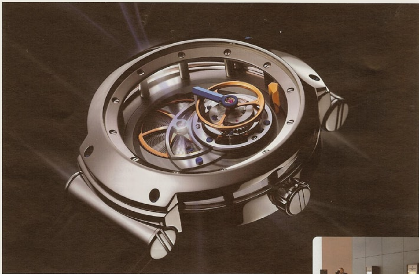
BLU Tourbillon MT3

отдельной статьи. Личность неординарная, он не только обладает талантом часовщика и дизайнера, но и является замечательным собеседником, тактичным и внимательным. Демонстрируя последние новинки, мастер уделял особое внимание их техническим особенностям, подробно объяснил разницу между традиционным турбийоном Бреге, «парящим» турбийоном и конструкцией, использованной в новом творении Blu – модели Tourbillon MT3.